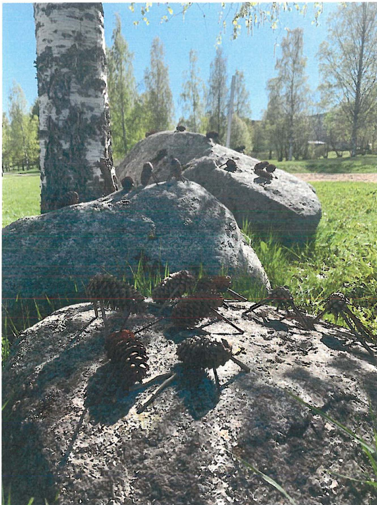
Kuva: Pekka Ouli, Rantapuisto

Äänekosken kaupunki Tarkastuslautakunta 28.5.2019